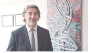
Onlara Koçluk Yapın

Özellikle arkadaşlık becerilerini geliştirmekte olan çocuklar için aileden ya da öğretmenden gelen destek önemlidir. Çocuğunuzun ne kadar desteğe ihtiyacı olduğuna bağlı olarak, gerçek zamanlı olarak eşlik edebilir, rehberlik edebilir ya da uzaktan gözlemleyebilir ve gerekirse önerilerde bulunabilirsiniz. Gruplardan Oluşan Ortamlarda