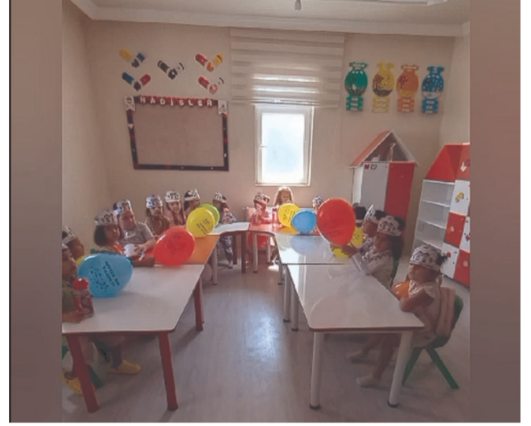
Programın açılış konuşmasında

Diyanet İşleri Başkanlığı'na bağlı 4-6 yaş grubu Kur'an kursları, 2023-2024 eğitim-öğretim yılına büyük bir heyecanla başladı. Diyanet İşleri Başkanlığı'na bağlı 4-6 yaş grubu Kur'an kurslarında yeni eğitim-öğretim yılı 11 Eylül 2023 itibarıyla başladı. Bu kapsamda il ve ilçe müftülüklerine bağlı Kur'an kurslarında "2023-2024 Eğitim-Öğretim Yılı 4-6 Yaş Grubu Kur'an Kursları Açılış Programı" düzenleniyor. Karapınar Müftülüğü'ne bağlı Hotamış Mahallesi 4-6 yaş Kur'an kursu öğrencileri, okullarındaki ilk günlerini "ilk günüm" etkinliğiyle kutladı.