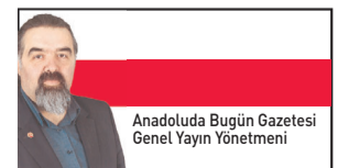
Anadoluda Bugün Gazetesi Genel Yayın Yönetmeni