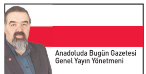
Anadoluda Bugün Gazetesi Genel Yayın Yönetmeni