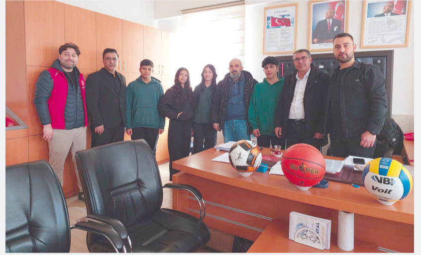
düzenlenen Okul Sporları Futsal