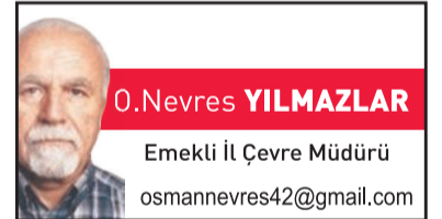
O. Nevres YILMAZLAR

ton olacağı, bu üretim için ise 1,8 milyon dekar tarım arazisinin gerektiği hesaplanmaktadır. 2030 yılı için ihtiyaç duyulan tarım arazisi miktarı 1,8 milyon dekar 2050 yılına göre hesaplandığında bu miktar 4,9 milyon hektara çıkmaktadır. Öngörülen ihtiyaçlar dikkate alındığında, tarım arazilerinin amaç dışı kullanımının engellenmesi için 5403 Sayılı Toprak Koruma ve Arazi Kullanımı Kanunu'nun öngördüğü şekilde "Toprak Koruma ve Arazi Kullanım Planları"nın hazırlanması, tarımsal potansiyeli yüksek, büyük ovaların tarımsal koruma alanı ilan edilmesi, toprağın sürdürülebilir yönetimi ve toprak koruma ve erozyonla mücadele tedbirlerinin acilen desteklenmesi gereklidir. Toprağı, sevdiği tohumu "Ata Tohumu" vermeliyiz. Ata tohumu, DNA dizilimine müdahale edilmeden ve saflığı korunarak çoğaltılan bir tohum çeşididir. Bu tohumlar, nesilden nesile yetiştirilen doğal ürünlerden elde edilir. Söz konusu ürünlerin temel özelliği; ekim, çoğaltma ve