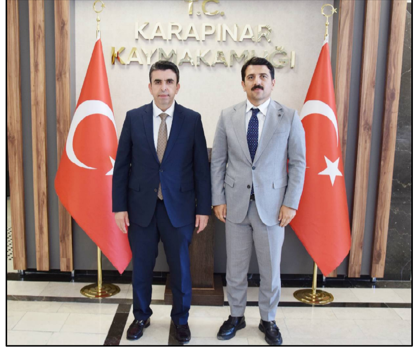
ardından hatıra fotoğrafı çekilmesiyle sona erdi.

Ziyaret, karşılıklı iyi dilek ve temennilerin paylaşılmasıyla